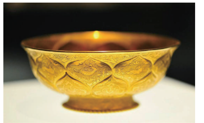
图并文 / 集团总部 王磊