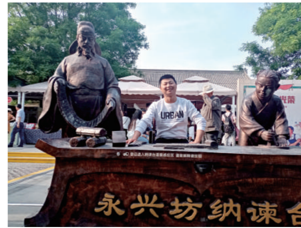
五月初我跟森信大家庭一行27人，进行了为期四天的西安之旅。

西安历史文化悠久，参观和学习价值特别高，如果我早点来西安游玩，可能我的历史就不会那么差了。言归正传，西安是一个凝聚华夏五千年历史的文化古城，这里曾是十三朝都会，蓝田遗迹，半坡文化，烽火戏诸侯都发生在这里，这里更留下秦始皇兵马俑统一天下丰功伟绩的历史足迹——秦兵马俑。