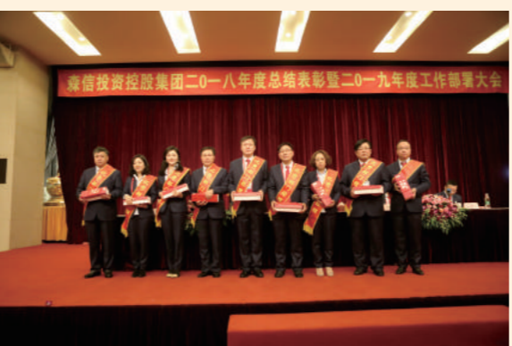
优秀部门经理(科室)