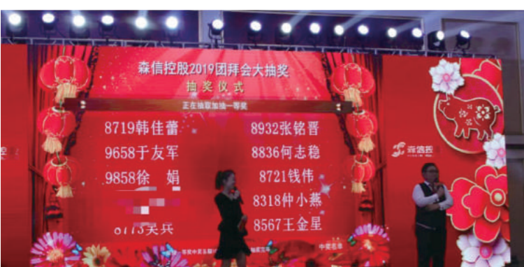
开心快乐的抽奖环节