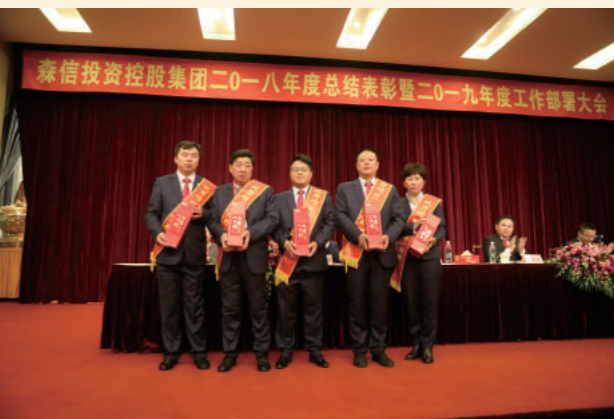
优秀项目(执行)经理