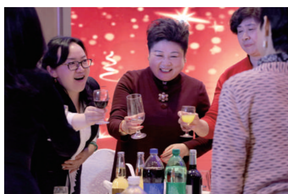
举杯祝愿森信明天更美好